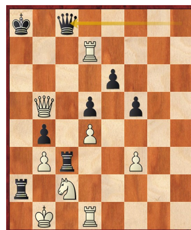
Figure 1: 44ème coup (noir)