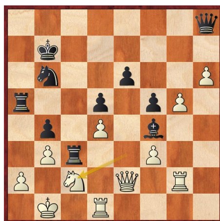
Figure 2: 38ème coup (noir)

Sauvetage inespéré de la partie en profitant de l'échec perpétuelle !!!